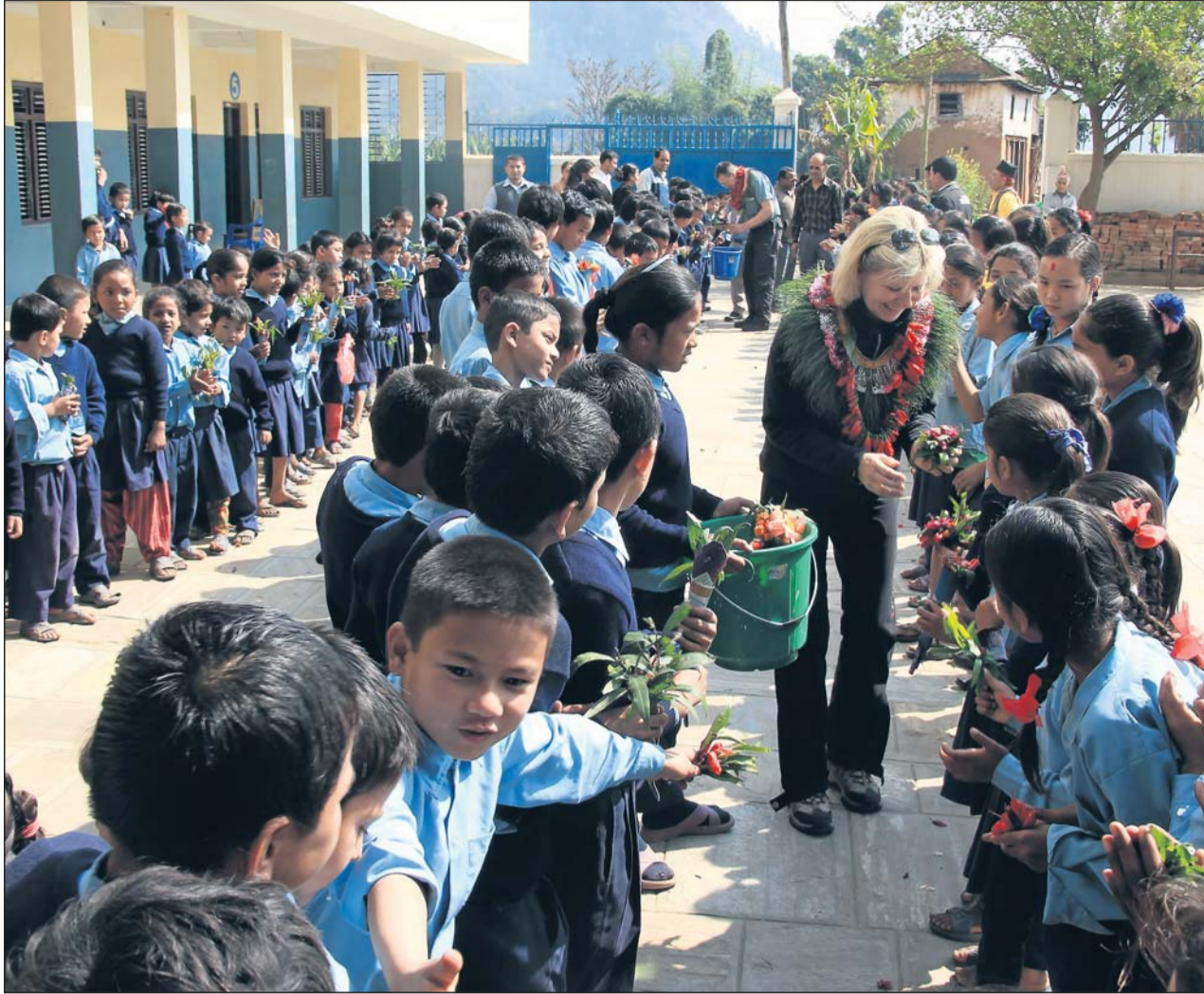
Blumenkinder: Eine herzliche Begrüßung bereiteten die Schülerinnen und Schüler ihren beiden Gästen aus Deutschland, auch wenn deren Aufgabe kein Grund zur Freude war.